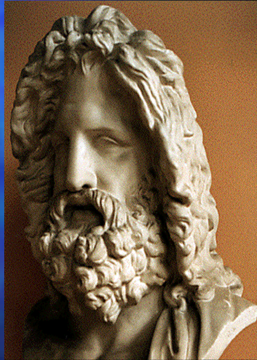
Zeus from Otricoli, 3CAD.

Representación El personaje es perfeccionado tiende al futuro y a la eternidad es (idealista)