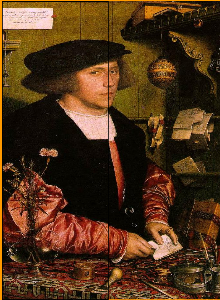
Retrato de Georg Giese Hans Holbein el Joven Renacimiento Tardío